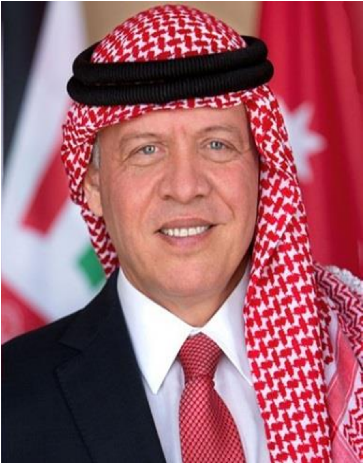
حضرة صاحب الجلالة الهاشمية الملك عبد الله الثاني ابن الحسين المعظم