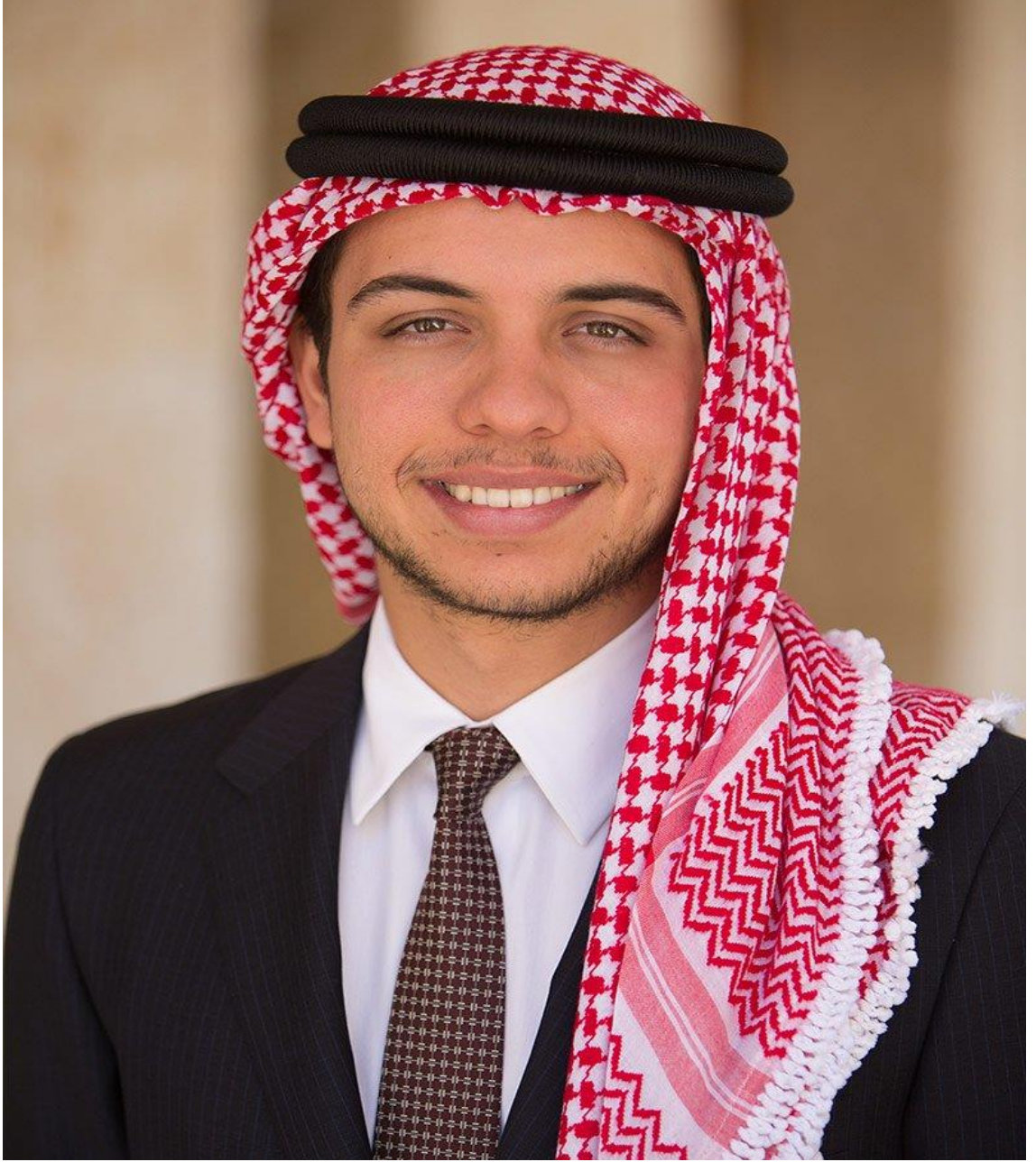
صاحب السمو الملكي الأمير الحسين بن عبد الله الثاني ولي العهد المعظم