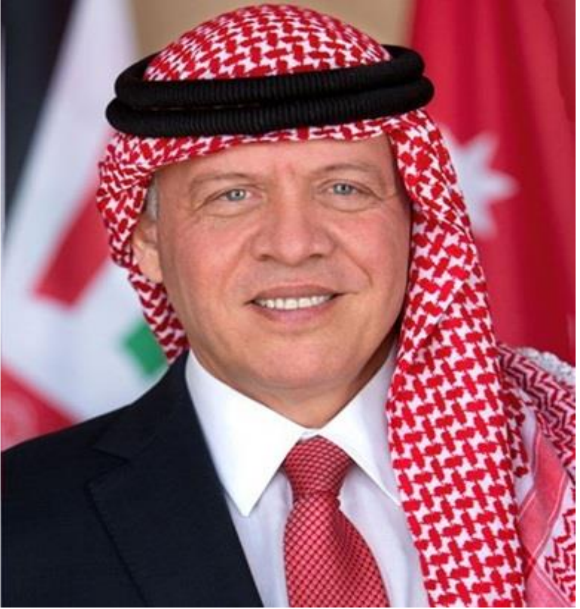
حضرة صاحب الجلالة الهاشمية الملك عبد الله الثاني ابن الحسين المعظم