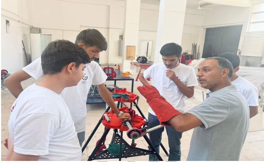
صور متنوعة من معسكرات الحسين للعمل والبناء 2023